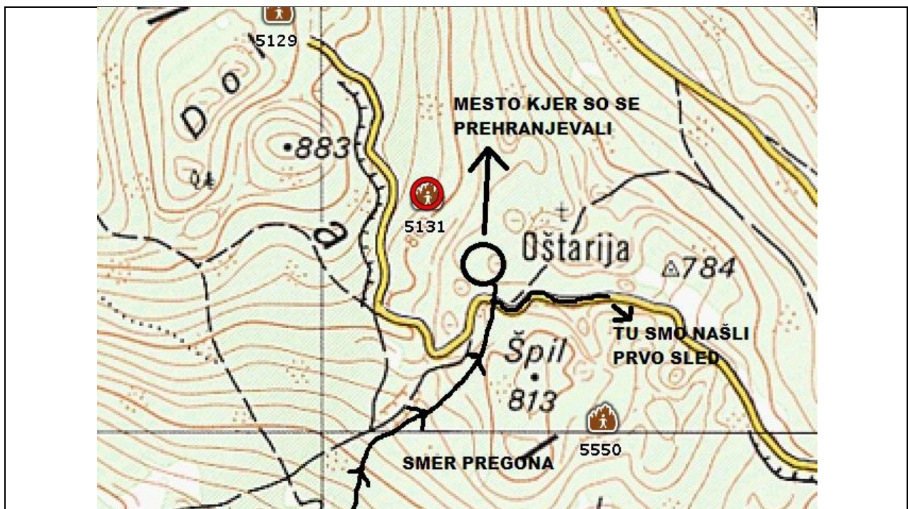
Slika 6: Kraj zločina.

Na koncu še zanimivost, ki sem jo odkril doma z brskanjem po internetu, saj me je zanimalo kje smo sledili volkove. Brskal sem po Geopediji in ugotovil, da gre za civiliziran trop volkov. Območje, kjer smo jih sledili in so se prehranjevali se imenuje "OŠTARIJA" (slika 6).