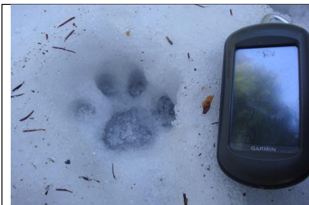
Slika 7: Sled risa.

Moje zadnje sledenje je bilo v sredo 29. 2. 2012. Sledenje je potekalo na severni pobočjih Snežnika in okolici Babnega polja. Z avtomobilom smo se zapeljali do gozdarske kočice Vavkovec. Od tu smo šli v dveh skupinah skupaj v smeri gozdarske kočice Stiska. Kakšen kilometer naprej smo se ločili. Ena skupina je šla levo in naredila krožno pot nazaj proti avtomobilu. Jaz in kolegica pa sva šli po poti proti Babnemu polju. Kmalu sva sledila sledem manjšega medveda, ki je približno 2 km hodil po cesti. Pot sva nadaljevala mimo Županovega laza. Kmalu sva naletela na sled risa, ki je markiral skalo ob cesti (slika 7). Žal vzorca nisva mogla vzeti, ker ni bilo nič rumenega snega. Ris je s ceste skrenil v gozd in sledila sva mu. Sledi so bile lepo vidne in kar velike, ker se je sneg že topil. Sledila sva ga približno 500 m po gozdu potem pa spet po cesti. Vmes je po njegovih sledih hodil tudi medved (200 m). Kmalu je ris zavil levo s ceste po pobočju navzgor, kjer ga nisva mogla več slediti. Pobočje je bilo skalnato in brez snega. V nadaljevanju sva naletela na iztrebek za katerega sva dvomila, da je volčji. Iztrebek je bil iz samih dlak in zelo ogromen (slika 8). V okolici pa samo sledi lisice in medveda. Vseeno sva ga spravila v vrečko in zapisala lokacijo.