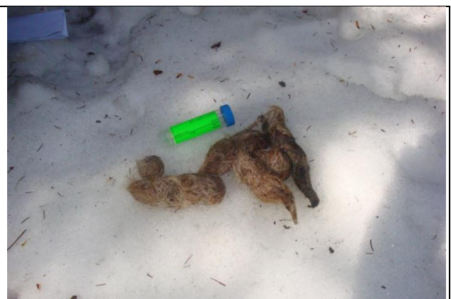
Slika 8: Volčji iztrebek?

Tako se je končalo moje zimsko sledenje volkov. Bilo je lepo in imel sem se super. Pri sledenju sem bil tudi uspešen, kar ti dodatno polepša uspeh. Z veseljem se bom udeležil še nadaljnjih zimskih sledenj in poletnega izzivanja volkov z oglašanjem.