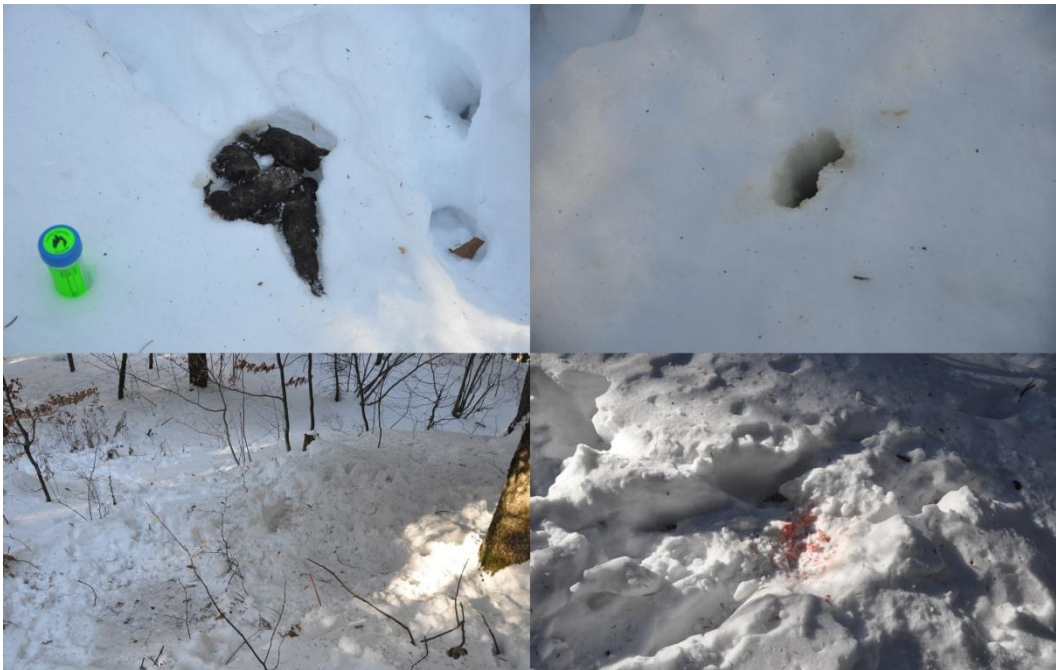
Slika 5: Iztrebek, uriniranje nedominantnega volka in ležišča.

kosti, za dva iztrebka pa nam je zmanjkalo vrečk. Izmerili smo tudi različno velike sledi. Ko smo imeli polne vse epruvete in vrečke smo se veselo odpravili počez proti Ribnici na zbirno mesto, kjer smo z velikim veseljem pripovedovali našo dogodivščino.