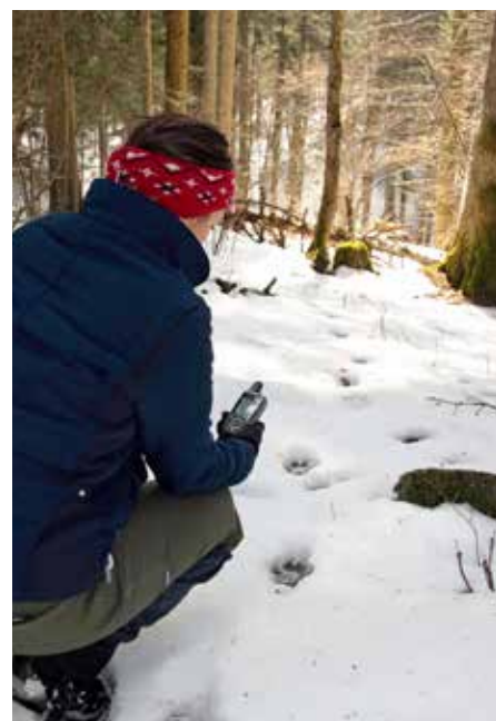
Wolf snow tracking