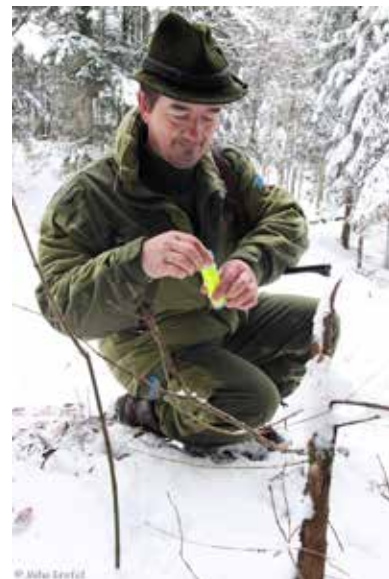
Lovci in ostali prostovoljci so sodelovali v projektne zimskem sledenju.

K zimskim sledenjem, poletnim izzivanjem oglašanja volkov in k zbiranju njihovih neinvazivnih genetskih vzorcev smo za ozaveščanje in boljše sprejemanje volkov povabili lovce in druge prostovoljce . Njihova pomoč pa nam je omogočila tudi pokrivanje razmeroma velikega projektnega območja na terenu, ki bi samo z delom zaposlenih strokovnjakov sicer predstavljal precejšen finančni zalogaj. V času projekta so prostovoljci pri spremljanju populacije vse skupaj sodelovali 2429-krat: na seznam za obveščanje o aktivnostih pri katerih lahko sodelujejo prostovoljci se je vključilo 984 ljudi, 891 se jih je udeležilo izobraževalnih predavanj, 453-krat so sodelovali v zimskih sledenjih in 245-krat pri izzivanju oglašanja. Poleg tega smo k sodelovanju pri zbiranju neinvazivnih genetskih vzorcev povabili tudi 108 lovskih družin, ki imajo skupaj preko 5000 članov. Poletna izzivanja oglašanja volkov so bila izvedena v treh zaporednih letih in ob tako številčnem vključevanju prostovoljcev smo lahko v enem dnevu dela na terenu pokrili 3384 km 2 . Enako smo v zimskem času tekom treh let organizirali 65 sledenj, na katerih smo za volčjimi sledmi pregledali 2230 km gozdnih cest. Volkove smo sledili na 171 km in na sledih zbrali 185 genetskih vzorcev. Velik interes in samo število vključenih prostovoljcev je presegel vsa naša pričakovanja.