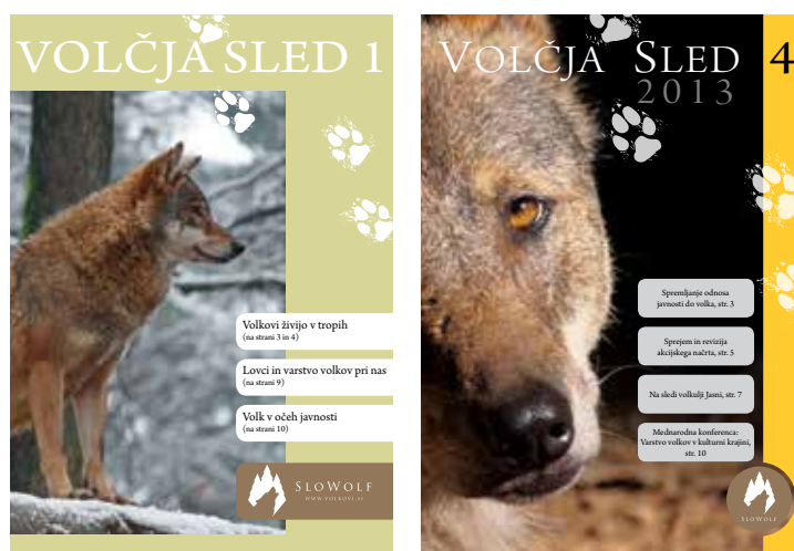
Letno projektne glasilo "Volčja sled".

Vsako leto smo pripravili tudi projektne bilten »Volčja sled«, v katerem smo na kratko povzeli in predstavili izvedene in prihajajoče projektne aktivnosti. V vsaki številki je nekaj projektne sodelavcev predstavilo svoj pogled na volkove in sodelovanje na projektu. V zadnji številki smo se vsem sodelujočim v projektu zahvalili za trud in prispevek k uspešni izvedbi tega projekta. Vse številke biltena so bile prav tako razposlane v knjižnice in razdeljene kjučnim interesnim skupinam za varstvo volkov (lovci, kmetje, upravljavci, gozdarji) na projektne območju.