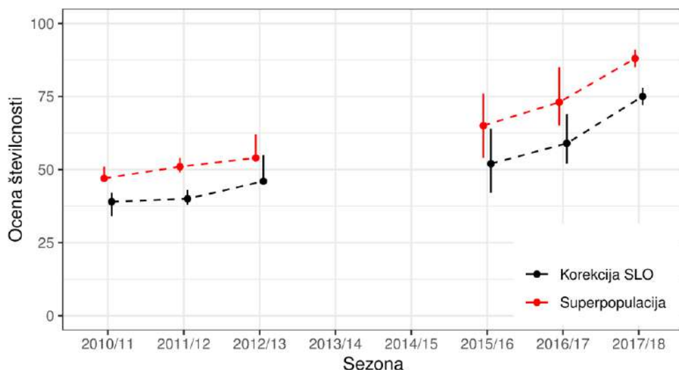
Slika II: Večletna dinamika številčnosti populacije volkov v Sloveniji. Točke so srednje ocene, navpične črte kažejo 95% interval zaupanja. Zaradi odlično izpeljanega vzorčenja je ocena za sezono 2017/18 bolj natančna kot v prejšnjih dveh sezonah in primerljiva z natančnostjo dobljeno v projektu SloWolf.

Večletna dinamika kaže, da populacija v zadnjih osmih letih odkar izvajamo monitoring polagoma narašča. Rast populacije gre v neki meri na račun prostorske širitve in večjega števila tropov, po drugi strani pa je več tropov doseglo »vitalno« populacijsko strukturo in ima več članov. Porast je nekoliko višji v zadnjem letu, verjetno tudi zaradi nizkega odvzema v sezoni 2016/17 in dejstva, da v takrat ni bil v smrtnosti zaznan noben reproduktiven volk. Tokrat je stanje nekoliko slabše, zabeležili smo smrtnost treh reproduktivnih živali. Posledično smo status dveh tropov opredelili kot »v razpadanju«, tretjega (Nanos) pa kot izginulega, saj v letošnji sezoni nismo na območju tropa zaznali nobenega mladiča, kljub temu, da smo zaznavali volkove v disperziji od drugod.